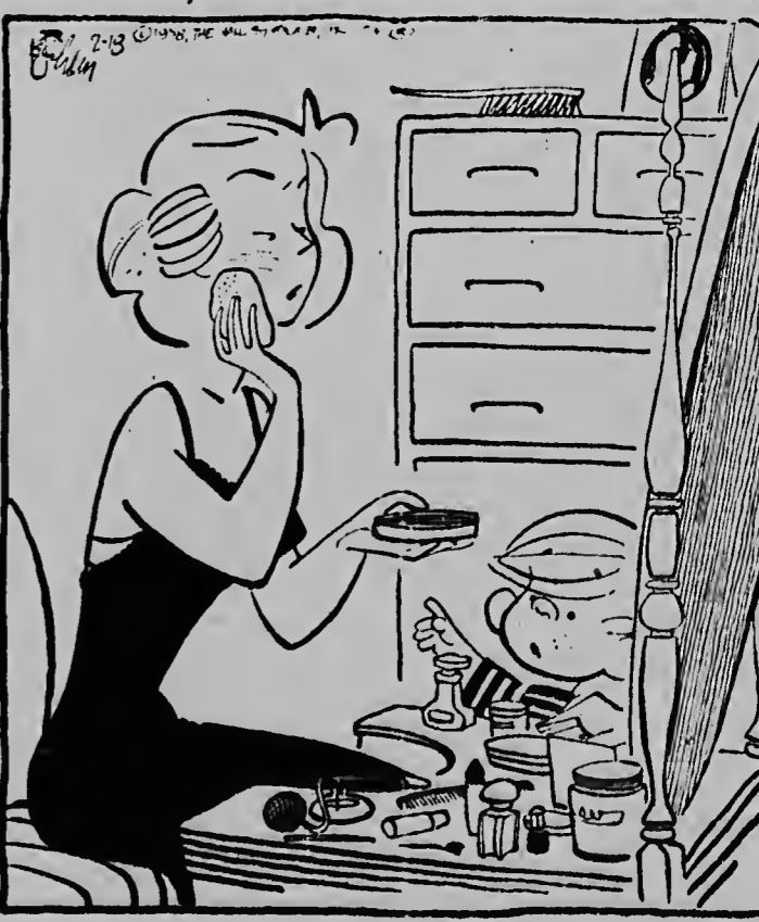
„Je licht een rimpelige overgeslagen!“